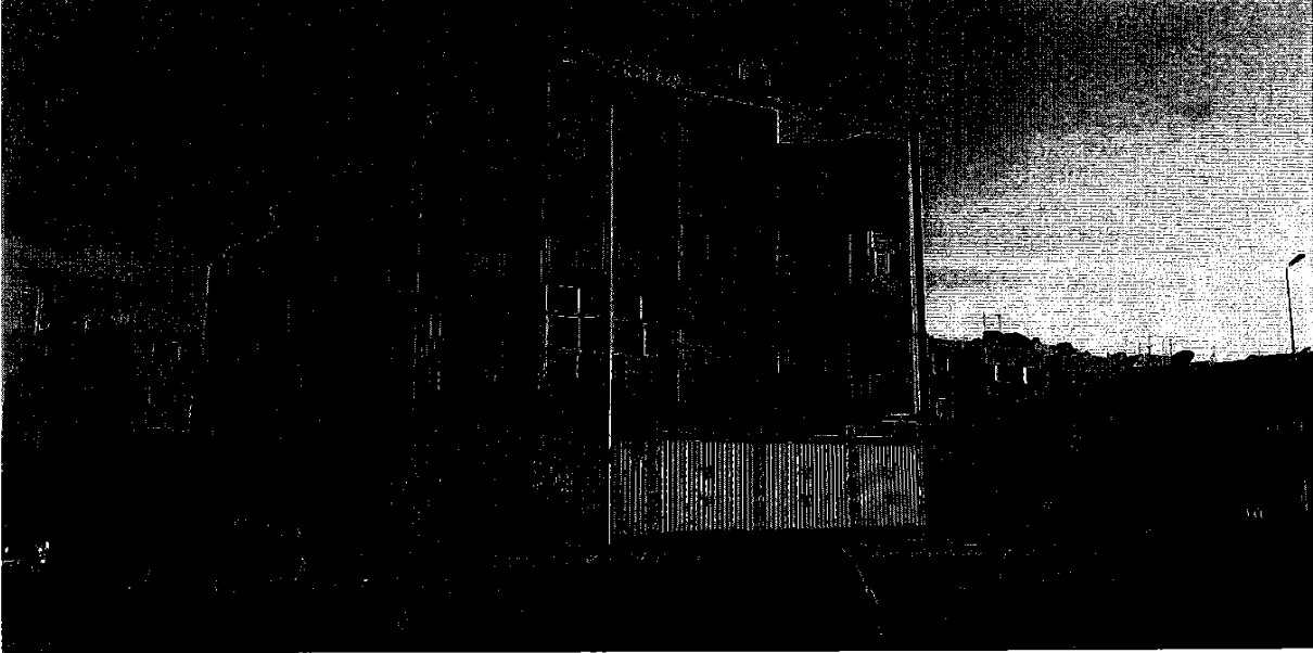
• صورة رقم 2 الباب الرئيسي للعمارة التي يتموقع بها العقار موضوع الحجز