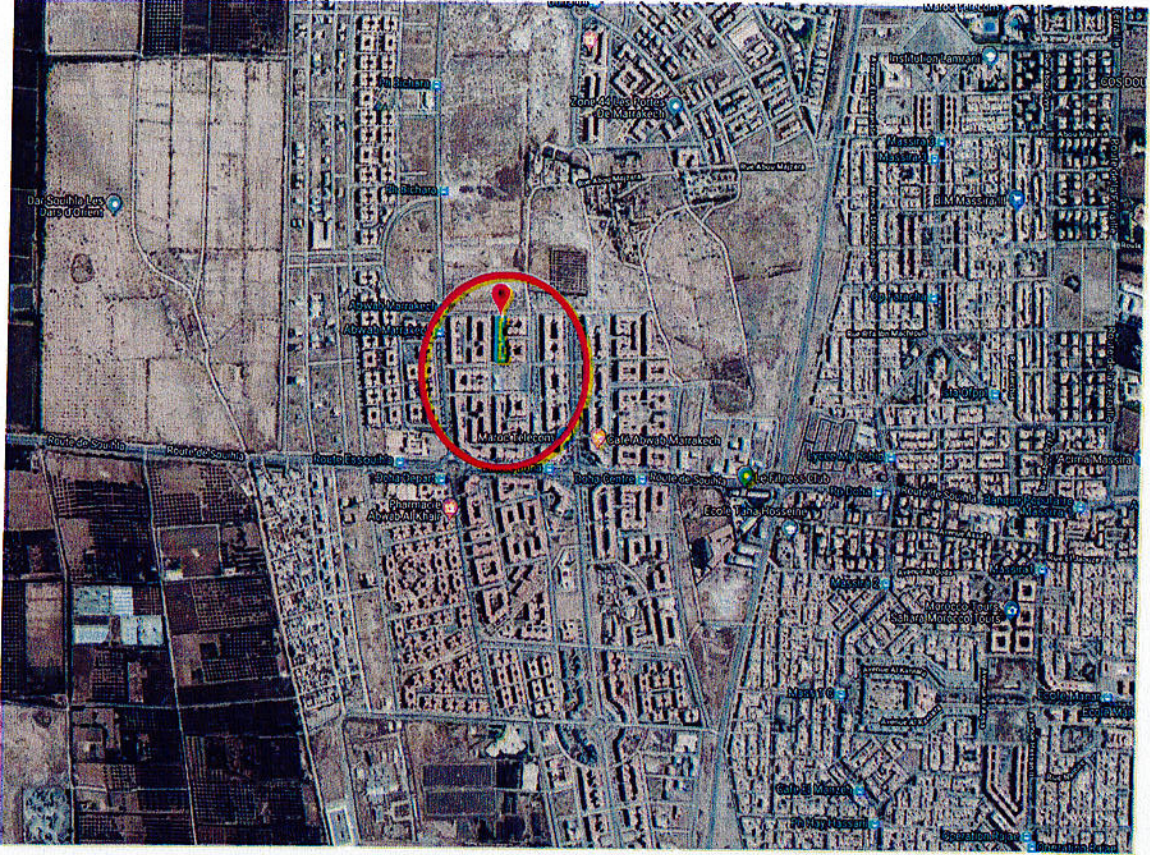
صورة عبر القمر الإصطناعي للمنطقة المتواجد بها العقار موضوع الخبرة ذي الرسم العقاري عدد 04/195953

توجهت بتاريخ 2018/10/12 على الساعة العاشرة صباحا إلى مكان الخبرة، العقار الكائن بمراكش المنارة تجزئة تاركة.