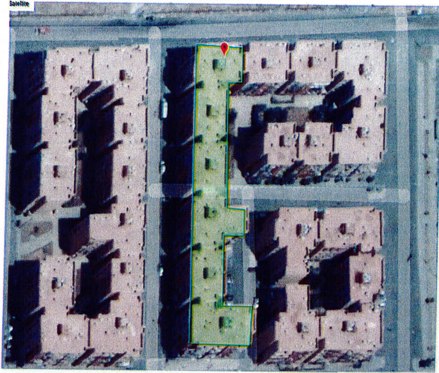
صورة عبر القمر الاصطناعي للعمارة المتواجدة بها الشقة موضوع الخبرة ذى الرسم العقاري عدد 04/195953