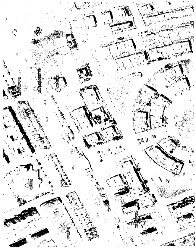
مستودع الخبثات في دور الخبثات بمخلفات المدن المستودع المصنوعي