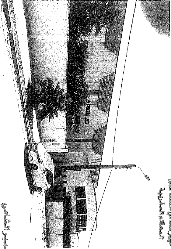
البنية التحتية للصناعة في المنطقة الطبيعية